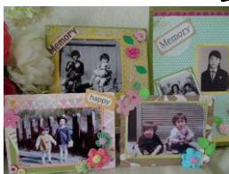
(一財)生前整理普及協会 生前整理アドバイザー 生前整理スクラップブック1級認定講師

写真の整理に困っている方、家族との絆を 深めたい方必見です！ 実際に思い出の写真を飾り付けて自分自身 の心の整理をしましょう！